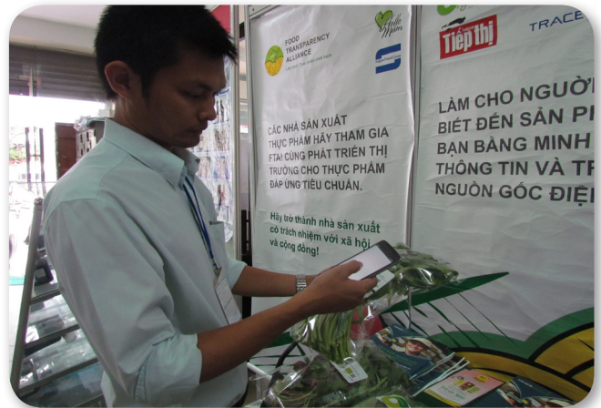
Người tiêu dùng chỉ cần quét mã QR bằng smartphone là biết đầy đủ thông tin nguồn gốc của sản phẩm mình sắp mua. Ảnh: LV.

Tuy nhiên, hệ thống này chỉ là công cụ, đơn vị sản xuất phải có trách nhiệm cung cấp thông tin trong từng khâu một, chứng chỉ kiểm nghiệm của nhà sản xuất. Nhiều doanh nghiệp có dây chuyền sản xuất phức tạp sẽ cần có hệ thống truy xuất nội bộ để quản lý thông tin sản phẩm. Nếu thực