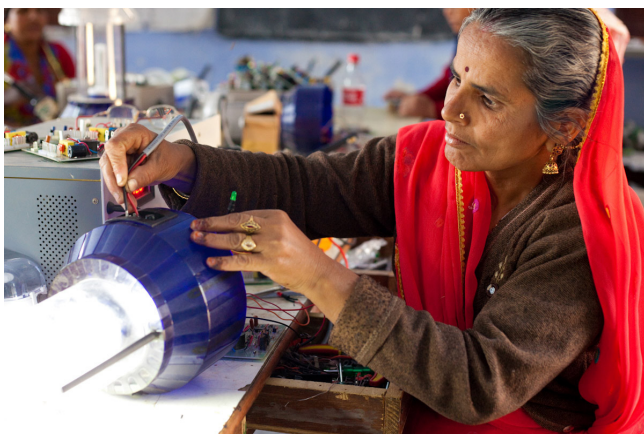
Chuyên gia không bằng cấp nhưng được cộng đồng công nhận.

Phần lớn lớp học diễn ra ban đêm để không ảnh hưởng đến sinh kế của học viên. Để những người ít học, mù chữ, thậm chí không thạo ngôn ngữ của giáo viên có thể tiếp thu các nội dung phức tạp, mọi bài giảng đều được trình bày bằng phương pháp trực quan sinh động. Ngoài cách lắng nghe, ghi nhớ, sử dụng hình vẽ, màu sắc, thì ngôn ngữ ký hiệu là biện pháp quan trọng giúp học viên vượt qua rào cản văn hóa, tiếng nói và chữ viết. Ngoài ra còn một phương pháp giảng bài đặc sắc nữa chỉ có tại Barefoot, đó là nghệ thuật múa rối