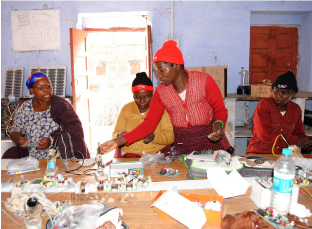
Học bằng màu sắc, ký hiệu.