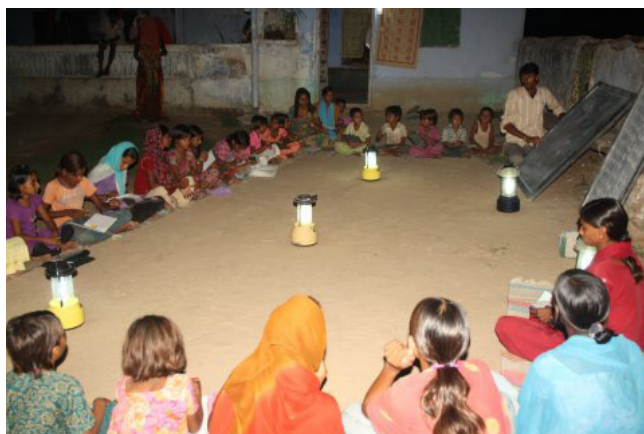
Lớp học đêm.