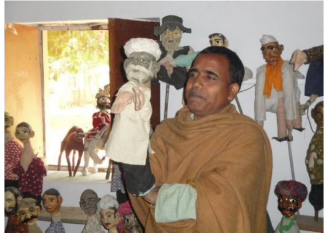
Giảng dạy bằng múa rối truyền thống.

truyền thống của Rajasthan. Tóm lại, chỉ cần sẵn sàng học hỏi, chăm chỉ, kiên nhẫn và chú tâm là có thể tốt nghiệp đại học Barefoot.