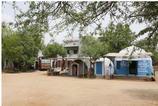
Ngôi trường gồm những kiến trúc hình mái vòm chắc chắn do dân làng tự làm từ kim loại phế liệu.