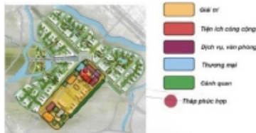
Các phân khu chức năng