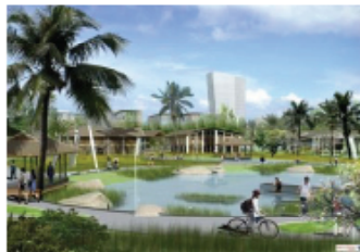
Không gian xanh, thân thiện môi trường