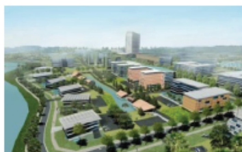
Phối cảnh nhìn từ hướng bờ sông. Kiến trúc thấp tầng từ 4 hướng, cao dần khi vào trung tâm