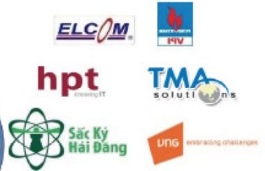
Các nhà đầu tư tiên phong