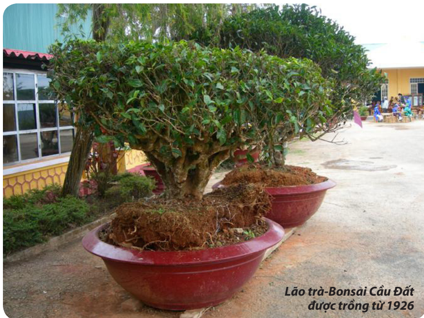
Lão trà-Bonsai Cầu Đất được trồng từ 1926

Từ sau lễ hội trà Việt lần thứ nhất 2006 tại thành phố Đà Lạt, thú thưởng ngoạn trà như được thổi một luồng sinh khí mới. Mới đây thôi, những cây trà cổ thời thực dân, lớp “vật chứng” hiếm hoi còn sót lại từ những vườn trà chủ Tây gây dựng hồi cuối thế kỷ 19, đầu thế kỷ 20 vút bỏ hoang phế, lẩn lóc, nay bỗng “lên