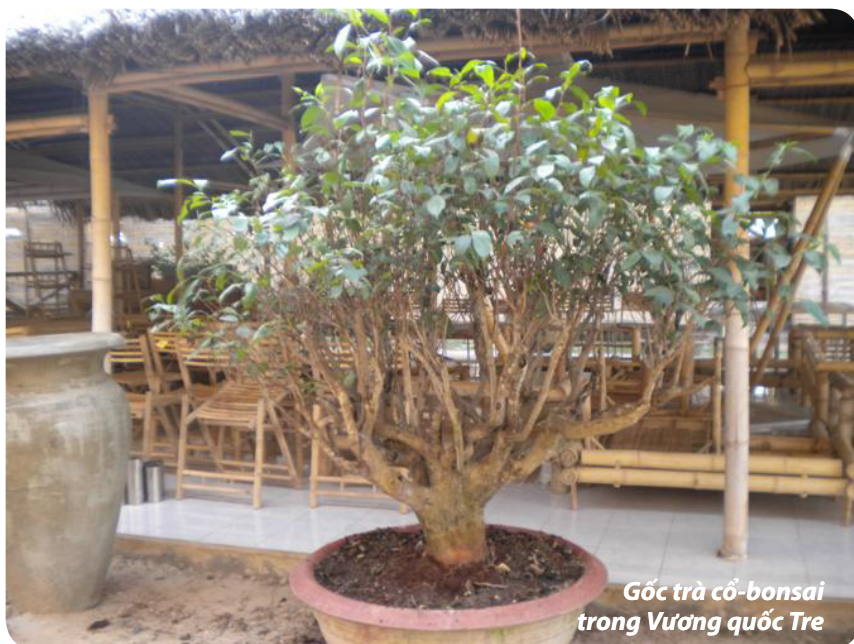
Gốc trà cổ-bonsai trong Vương quốc Tre

Ở đầu cực Nam của đất nước, Tp. HCM, các trà sĩ Phương Nam lại chọn chơi trà cổ từ vùng B'laio xứ Langbiang xưa (Bảo Lộc Lâm Đồng). Tuổi đời tuy có thấp hơn, chỉ từ 50 năm đến cao nhất là 120 năm, nhưng chúng thực sự lại có ngoại hình giống bonsai. Không cao quá 1,2m và chiếm diện tích chỉ