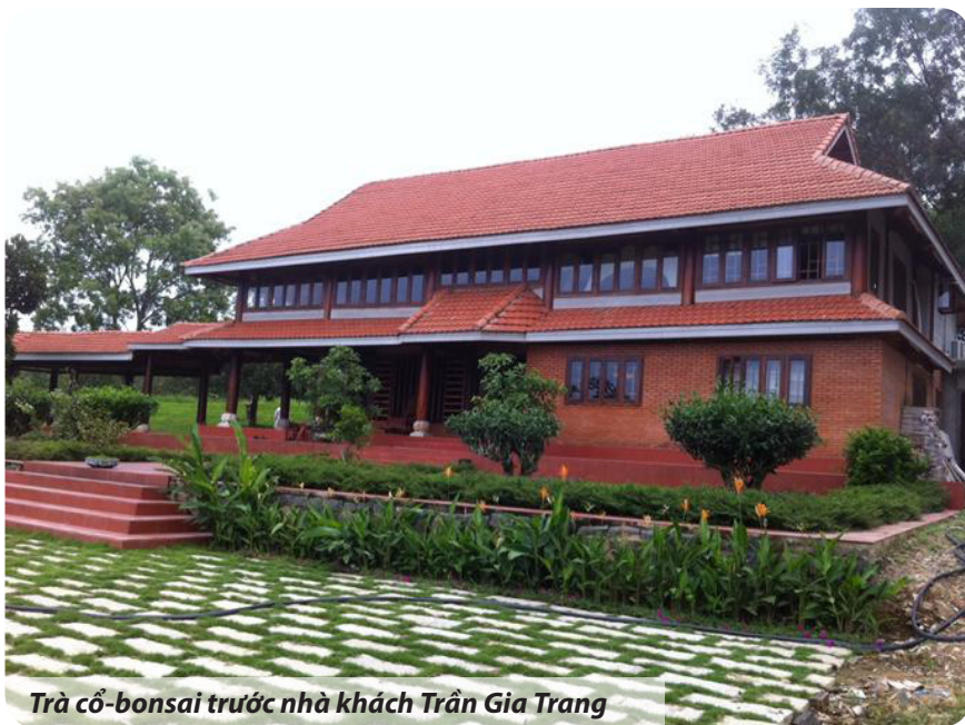
Trà cổ-bonsai trước nhà khách Trần Gia Trang

trà lâu niên. Ủ trong giàn, sẽ làm đỏ nước và mất vị tươi của nó... Thú chơi mới bắt đầu, nên nghệ thuật pha trà tươi cổ thụ còn nhiều thách đố... rộng đường sáng tạo cho giới trà sĩ ngày nay khám phá.