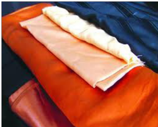
Một số mẫu Lãnh Mỹ A với các màu sắc khác nhau