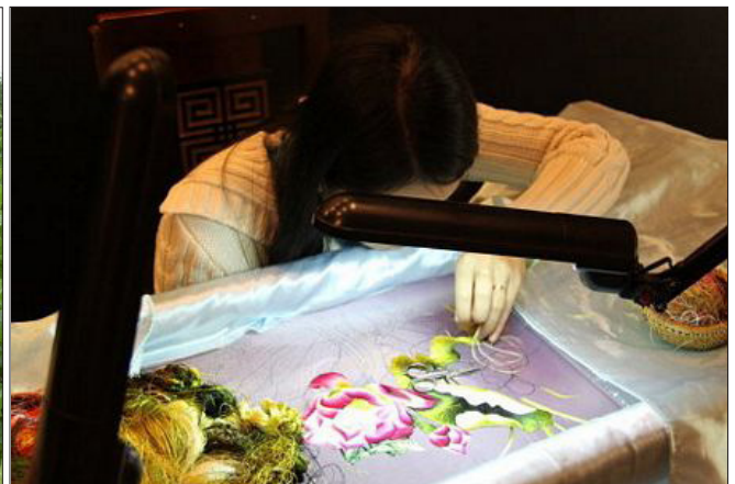
Một nghệ nhân đang thêu tranh trên lụa