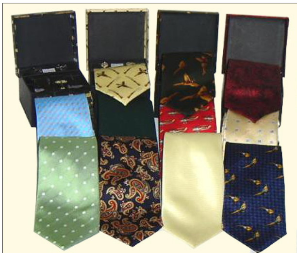
Cà vạt lụa tơ tằm, hoa văn dệt