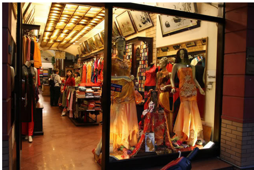
Một cửa hàng bán sản phẩm lụa tơ tằm

Công nghệ trồng dâu, nuôi tằm, xe tơ, dệt, nhuộm lụa ngày càng hoàn thiện. Có rất nhiều loại vải khác nhau từ tơ tằm. Ngày xưa có vải lĩnh hay lãnh là lụa dệt dày rồi đem phết hồ, đoạn giống như lĩnh nhưng dày hơn, the (còn gọi là sa ) và xuyến cùng là hàng dệt dùng sợi mỏng và dệt thưa, có thể nhìn xuyên qua được nhưng được dệt khác kiểu. Hàng dệt bằng tơ có chất lượng kém như tơ bị sẵn hoặc có cục thì gọi là sỏi (chối), đũi hoặc nái , hàng này thô nhưng bền.