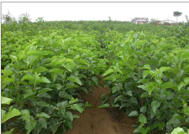
Bãi trồng dâu thôn Lương Phú, xã Thuận Mỹ, Ba Vì

Dù được phổ biến hơn nhưng tơ tằm hầu như vẫn là loại vải dành cho những người giàu có, bởi dù có nhiều tính năng vượt trội nhưng giá lụa tơ tằm đắt hơn những loại vải khác, khi may phải cẩn thận, tiến công may một chiếc áo dài bằng lụa tơ tằm thường đắt hơn những loại vải khác; khi sử dụng lại càng phải cẩn thận, giặt bằng tay với các chất tẩy rửa có tính kiềm thấp và phải phơi trong bóng râm. Đỏng đảnh là thế, nhưng vẻ đẹp