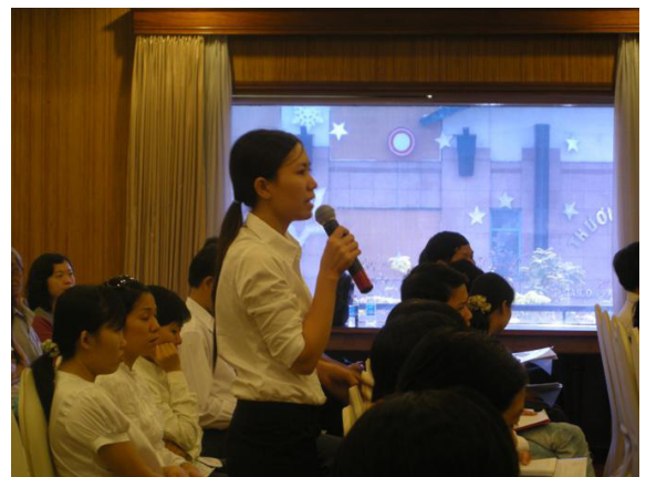
Đại diện doanh nghiệp đang nêu câu hỏi tại buổi hội thảo

Dẫu biết rằng thật khó thay đổi một thói quen, nhưng trong thế giới công nghệ thông tin như hiện nay, không khó để doanh nghiệp và các đơn vị quản lý nhà nước khai thác sử dụng kênh thông tin hiệu quả mà lãnh đạo TP.HCM đã quan tâm đầu tư. Hy vọng sang năm mới, ngày càng có nhiều doanh nghiệp biết đến kênh thông tin online này và hệ thống “Đối thoại Doanh nghiệp - Chính quyền thành phố” sẽ được sử dụng hết công suất để doanh nghiệp và chính quyền đến thật gần nhau và những vướng mắc của doanh nghiệp sẽ được các ban ngành Thành phố giải đáp, tháo gỡ kịp thời mà không cần đến các buổi hội họp. □