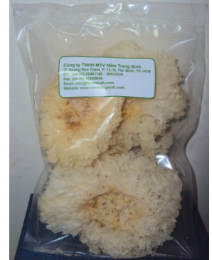
Các sản phẩm nấm Đông cô, nấm rơm, nấm Tuyết... của Cty Trang Sinh