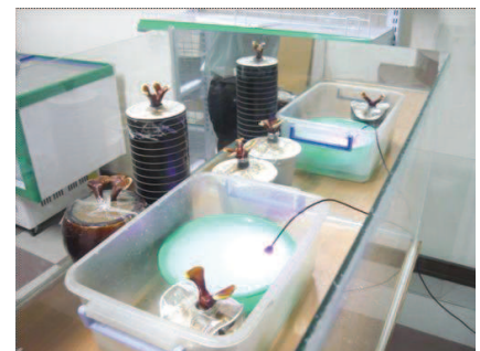
Mô hình thử nghiệm điều kiện sinh trưởng của nấm linh chi tại Trang Sinh.

Việt Nam bước đầu đã nuôi trồng thành công và tiêu thụ nấm linh chi tại thị trường trong nước. Trong đó, TP.HCM được xem là cái nôi của phong trào trồng nấm, từ kỹ thuật, mô hình đến con giống... Tuy nhiên, bức tranh chung về nghề trồng nấm vẫn là “giậm chân tại chỗ” và không thực sự dễ “sống” như nhiều người vẫn tưởng.