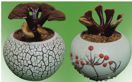
Linh chi kiếng đa dạng với giá 50.000 VNĐ