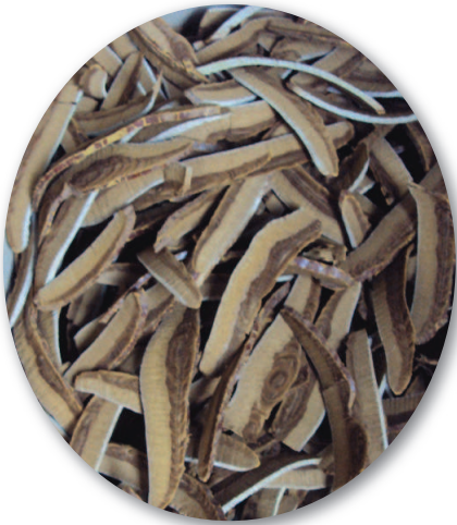
Linh chi cắt lát mỏng

Có những mô hình sản xuất nông nghiệp công nghệ cao, chuẩn thống nhất từ sản xuất và cung cấp giống, nuôi trồng, thu hoạch, bảo quản và chế biến để tạo cơ sở cho phong trào lan tỏa và đi lên.