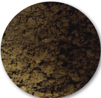
Linh chi bột

Trang Sinh đã nuôi trồng và cung cấp nấm linh chi dưới nhiều dạng như: linh chi cắt lát (có thể dùng pha nước uống hàng ngày như các loại trà); linh chi bột, cao linh chi; tai nấm linh chi... Nhờ đảm bảo kỹ thuật nuôi trồng, các sản phẩm linh chi của Trang Sinh có tác dụng dược liệu thực sự chứ không phải chỉ "nghe nói". Đặc biệt, Trang Sinh đang phát triển sản phẩm mới từ nấm linh chi, đó là linh chi kiếng.